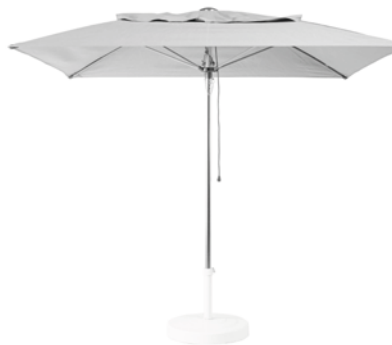
Gris U4 501 235