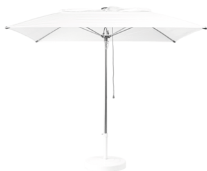
Blanc U4 501 096

Les mesures indiquées sont des valeurs moyennes et peuvent légèrement varier sur le produit