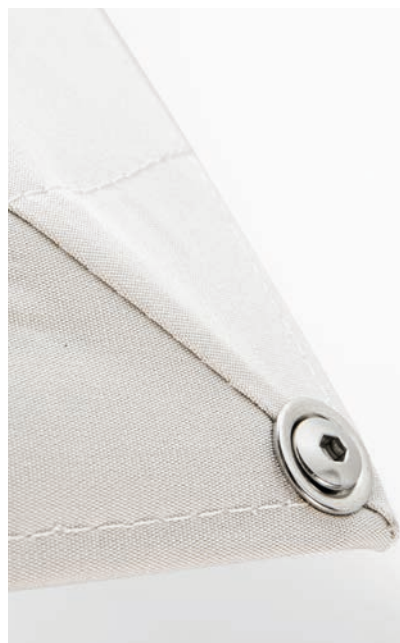
Vis et accessoires inoxydables