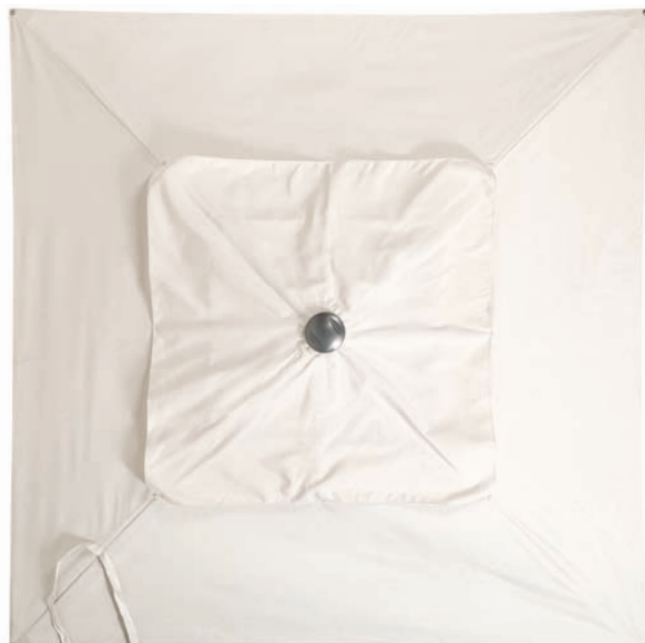
Cheminée XL - baleines de renfort intégrées