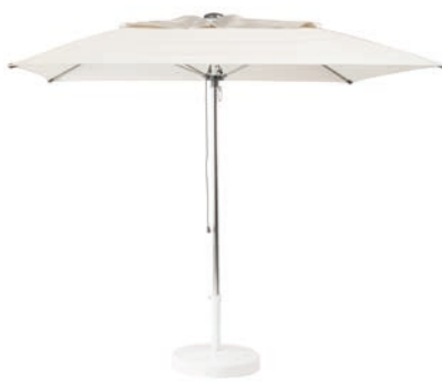
Beige U4 501 003