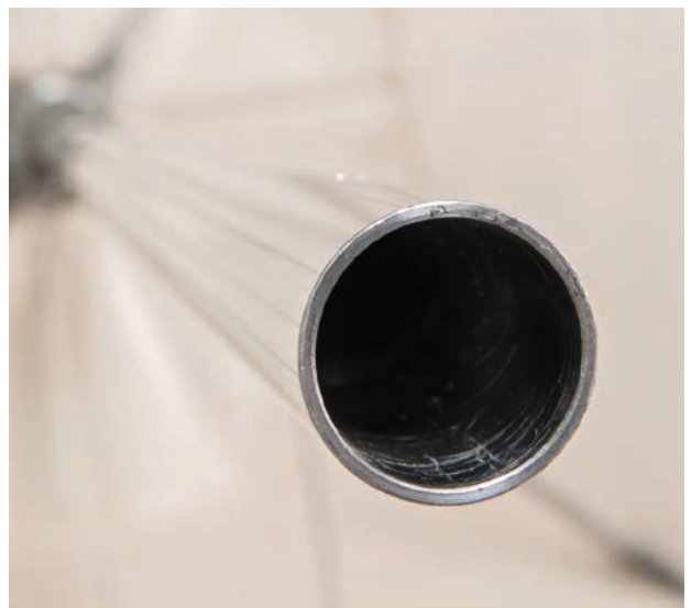
Mât central aluminium anodisé \varnothing 38 mm. Épaisseur tube 2,5 mm