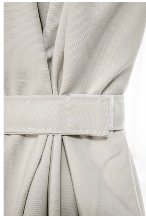
Fermeture toile par scratch