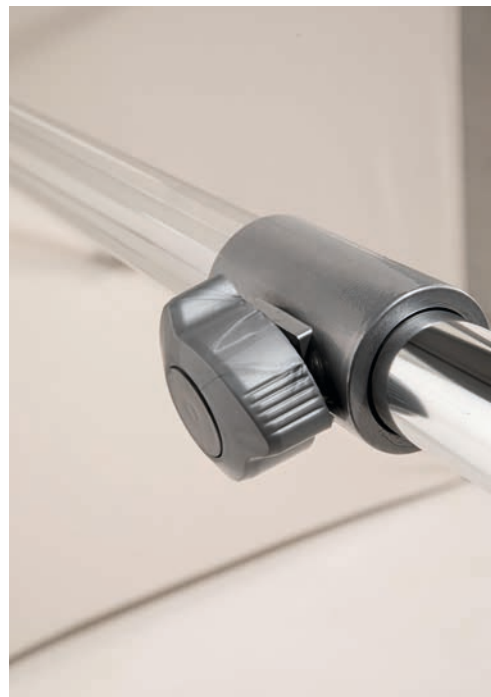
Mât 2 parties – molette de serrage