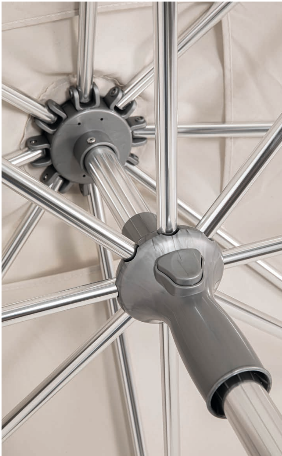
Mât inférieur \varnothing 35 mm Épaisseur 1,4 mm