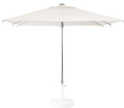
Beige Q8 403 003