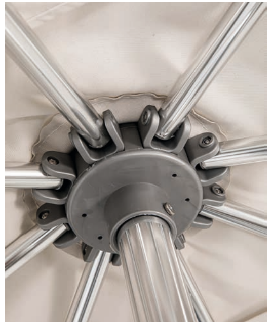
Baleines tubulaires \varnothing 19 mm Épaisseur 1,2 mm