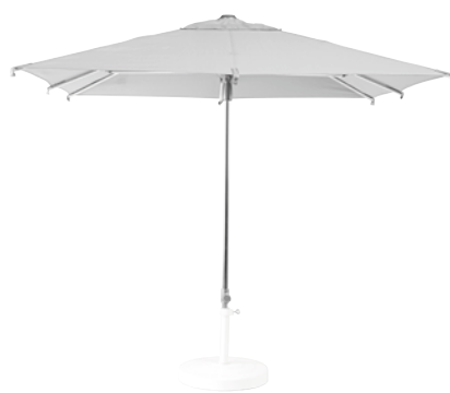
Gris Q8 403 235