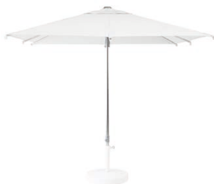
Blanc Q8 403 096

Les mesures indiquées sont des valeurs moyennes et peuvent légèrement varier sur le produit