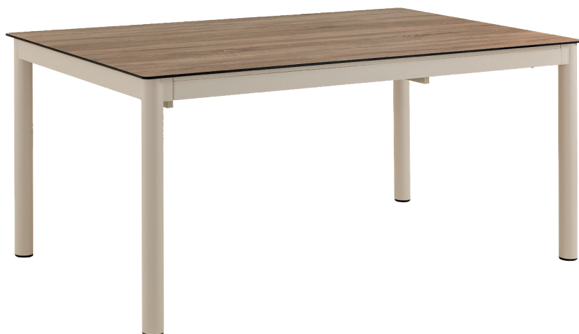
Sweden Oak / Grège S8 003 821