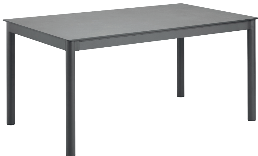
Anthracite Granite / Gris Pavement S8 003 713