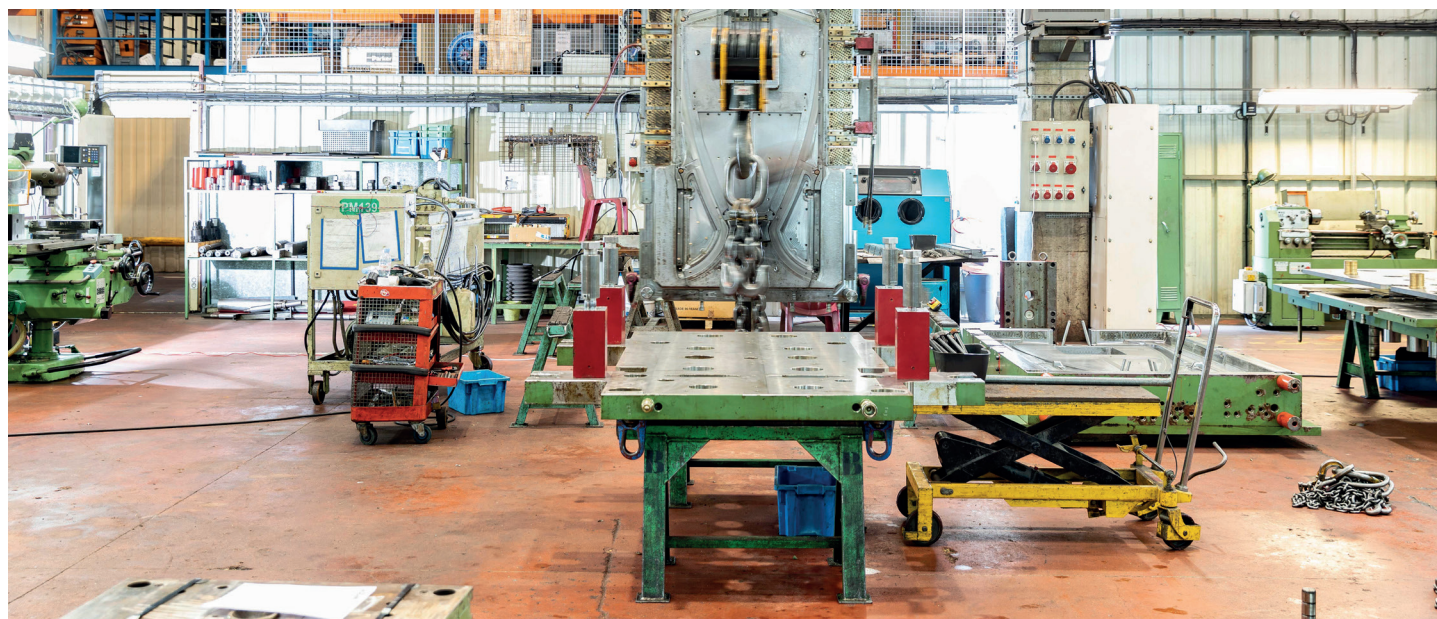
Site d'injection, La Plaine, Arbent, France.